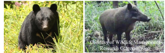
Asian Black Bear