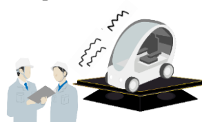
New product testing by start-up companies