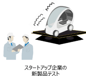
スタートアップ企業の 新製品テスト